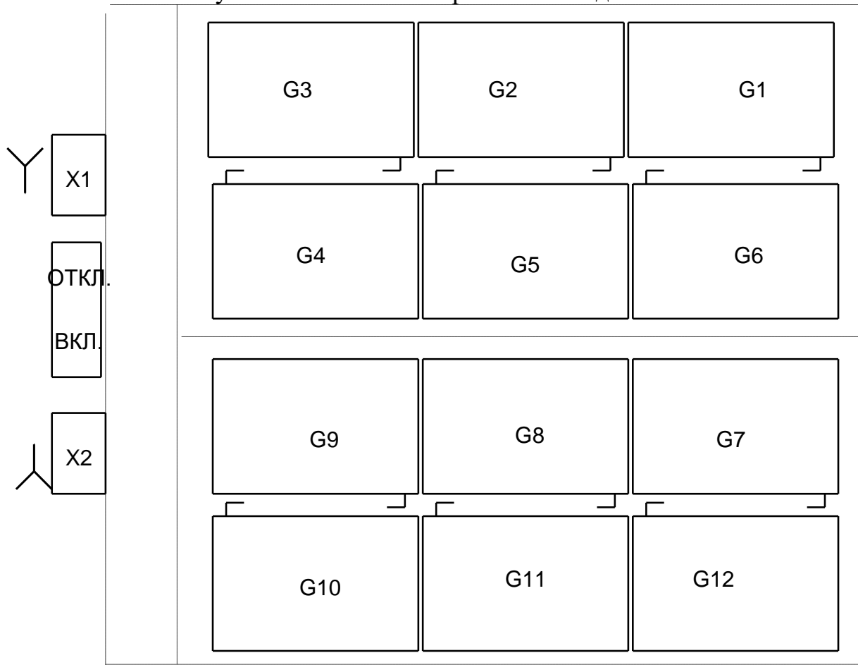
Рисунок 3 – Схема установки и соединений аккумуляторных батарей

Комплектность изделия приведена в таблице 1.